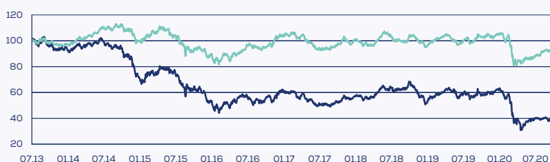
Dati calcolati da Ossiam al 30.09.2020. Fonte: Ossiam, Standard & Poor's

— Ossiam Risk Weighted Enhanced Commodity Ex Grains TR UCITS ETF 1C (EUR) — S&P GSCI® Index (EUR)